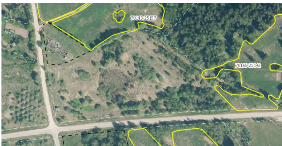
5.1. attēls. Īpašums "Poligons" lauku bloku kartē. 39

Īpašumā netiek konstatēti ES nozīmes biotopi un bioloģiski vērtīgie zālāji. (skatīt 5.1.attēlā)