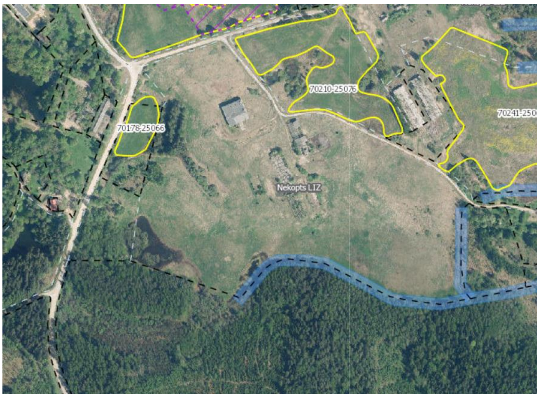
5.2. attēls. Īpašums "Šķeldas" lauku bloku kartē. 40

Īpašumā netiek konstatēti ES nozīmes biotopi un bioloģiski vērtīgie zālāji. (skatīt 5.2.attēlā)