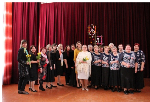
Līgas Ratnikas teksts un foto

Paldies Maltas kultūras namam par atsaucību un atbalstu, kā arī skatītājiem, kas atnāca uz pasākumu.