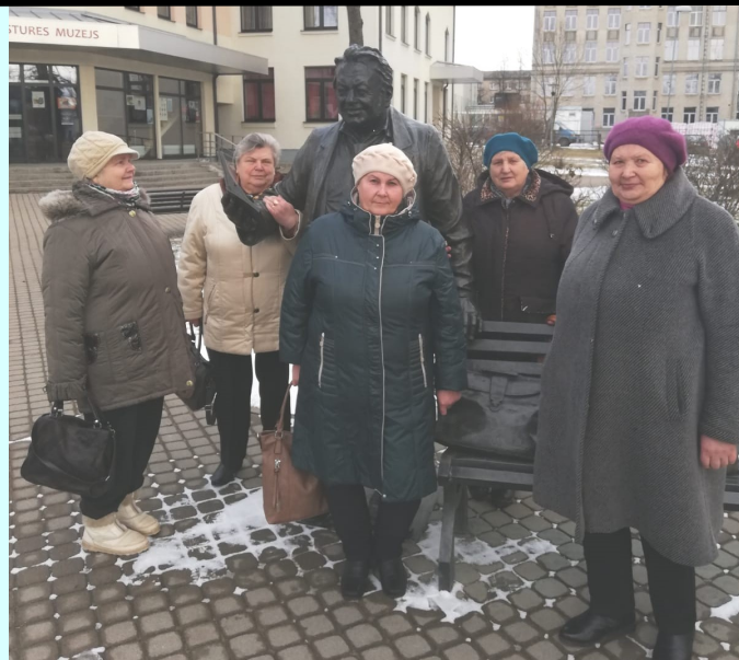
Nelielais pensionāru pulciņš pie Antona Kūkoja pieminēkļa

Arī mēs iemūžinājām mūsu prieka mirkļus.