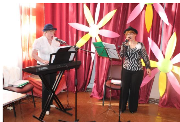
M. Krasnobajas teksts un foto

Mēs esam, kamēr dzīvojam. Tiksimies nākamgad vēl kuplākā pulcīnā!