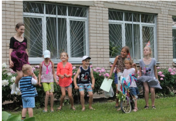
Parādes mazākie dalībnieki