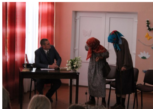
Pie predsedaceļa kunga