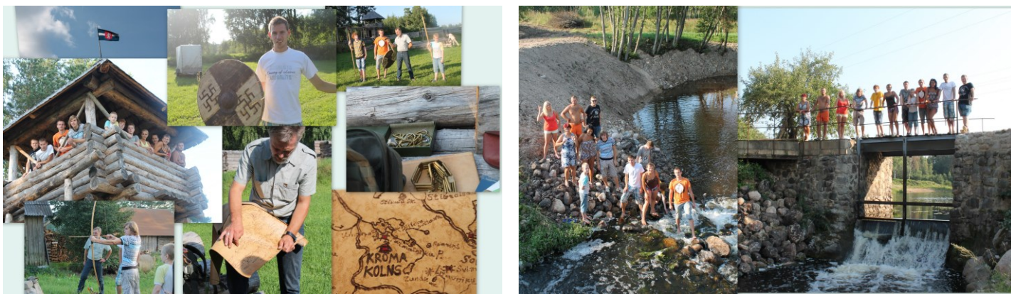
Kroma kolnā

Tieši tāpēc laika posmā no 5. – 9. augustam Pušas pagastā divpadsmit drosmīgākie un patriotiskākie Rēzeknes novada jaunieši piedalījās biedrības „Muosys MM” veidotajā projektā „Latgolys jaunī kolnā kuopieji”. Jauniešiem tika dota lieliska iespēja pašiem iepazīties ar sentēvu kultūras mantojumu Mundu ģimenes „Mežmalu” mājās, kur viņi mācījās paši pīt grozus, ausekļus un iepazīties ar senlietu muzeju. Savukārt radio un senlietu muzejā „Radio randiņš” jaunajiem kalnā kāpējiem tika dota iespēja pašiem saredzēt sev apkārt esošajās lietās unikālītāti un to pielietojuma iespējas, kas ļauj sniegt ne tikai estētisko baudījumu, bet arī izglītojošo.