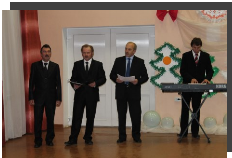
Gaigalavas vīru vok. ans. „Ritums”

Dzīve ir brīnumu pilna un ja kaut ko ļoti vēlas, tas piepildās. Un lai arī ārā Ziemassvētku sniegoto brīnumu nesagaidījām, tomēr svētku sajūtu sirdī atradām.