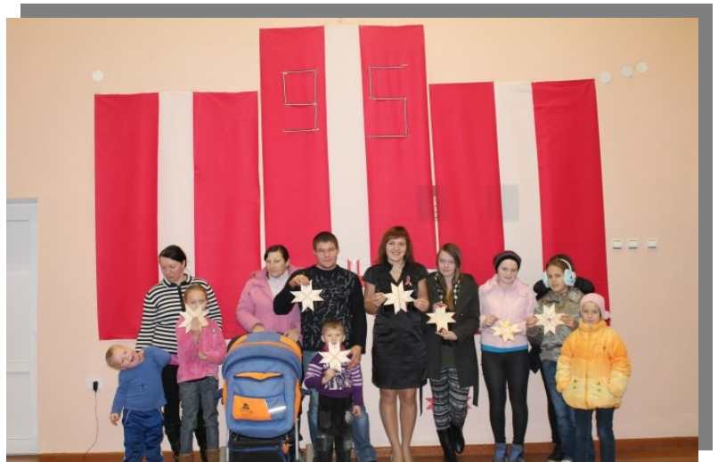
Radošās darbnīcas dalībnieki