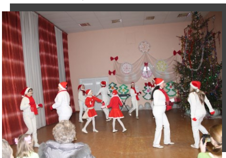
„Pirmais solis” uzstājas ar rūķu deju