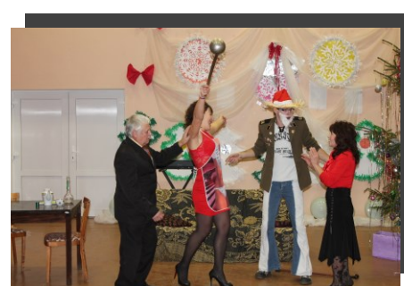
Fragments no izrādes „Ari politika”