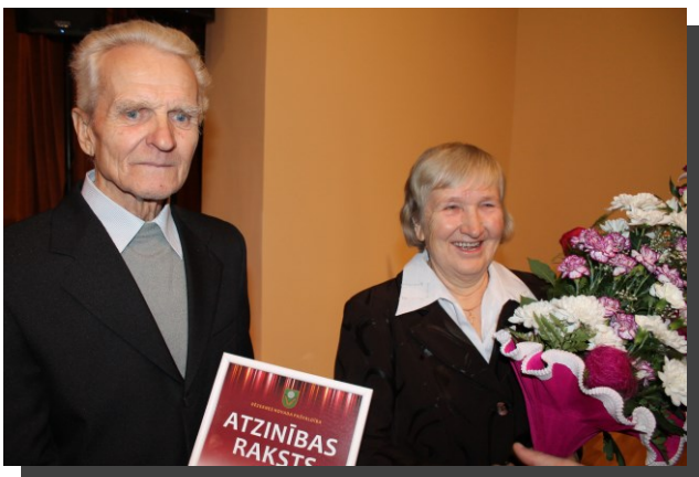
Mundu ģimene sveikšanas brīdī

Cien. Mundu ģimene! Lai Jums ir stipra veselība un neizsīkstošs darba spars arī nākotnē!