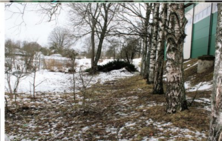
Teritorijas fotouzņēmums (zemes vienība ar kadastra apzīmējumu 78960050546), kurā iecerēts izveidot plānoto piekļuvi

Priekšlikumus un atsauksmes aicinām iesniegt no 21.04.2017. līdz 10.05.2017. Rēzeknes novada Vērēmu pagasta pārvaldē, J. Zvīdra iela 1, Sondoros vai sūtīt elektroniski uz e-pastu: info@veremi.lv, info@rezeknesnovads.lv. Informācija pa tel. 64628833.