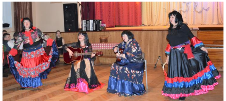
Pirmo reizi mūsu TN – čigānietes!

Šoreiz pašdarbnieku svētkus bagātināja arī kupls ciemiņu pulks – Griškānu KN čigānu ansamblis „Čarger”, Audriņu KN vokālais ansamblis „Ivolga”, Rikavas KN eksotisko deju kopa „Adelante”, Nautrēnu KN jauniešu deju kolektīvs „Troks voi”. Sākumā uzstājās mūsu kolektīvi, tad – ciemiņi. Tik skanīgs, tik košs, tik garš koncerts sanāca! Liels un mīļš paldies visiem – gan māksliniekiem, gan skatītājiem!