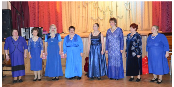
Skanīgā „Ivolga” no Audriņu KN.