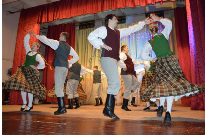
Uz skatuves – „Pipareņš”!

Gāju ceļu dziedādama, Gāju ceļu dancodama; Lai iet manis pēlājiņš Nopakālis raudādams.