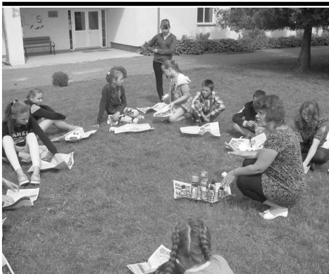
Jaunatnes neformālo apmācību projekts „SoLis”