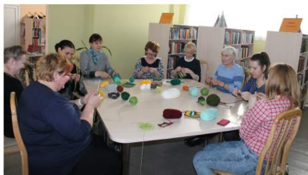
Top skaisti kvadrātiņi

Kaunatas pagasta 1. bibliotēka kopā ar mūsu pagasta rokdarniecēm ņem līdzdalību akcijā "Radīsim sirds siltumu" - Musturdeķa tapšanā.