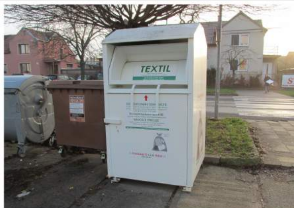
Tekstila konteineri Čehijā

Latvija ir tikai ceļā uz atkritumu šķirošanu un samazināšanu. Piemēram, Igaunijā ir uzstādīti vairāk kā 930 bankomātu, kur var nodot plastmasas pudeles, pretī saņemot čeku 4-8 euro centu vērtībā atkarībā no pudeles izmēra. Čehijā ir atsevišķi konteineri pat tekstilam.