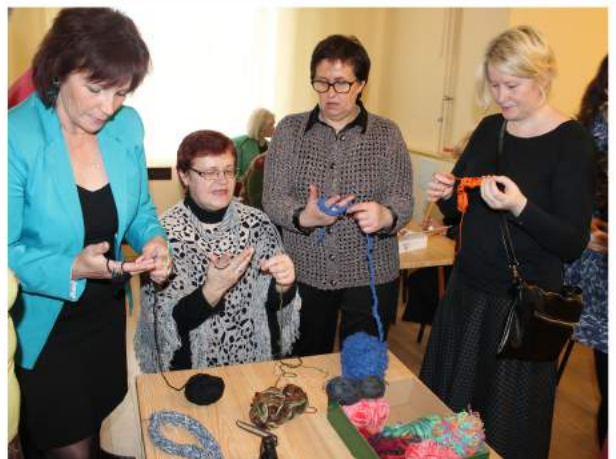
Radošā darbnīca: skaistums bez adatām

Teksts Marta Vasiljeva