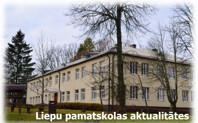
Liepu pamatskolas aktualitātes

brīvdienas lietderīgi. Viņi apmeklēja seminārus, papildināja savas zināšanasursos, bija Kaunatas vidusskolā, kur notika metodiskā diena. 24.oktobrī Liepu pamatskolas skolotāji apmeklēja Maltas vidusskolu, kur kopā ar 1.un 2.korpusa skolotājiem aktīvi apsprieda metodisko tēmu „Izglītojamo aktīva un motivēta mācīšanās stundās”.