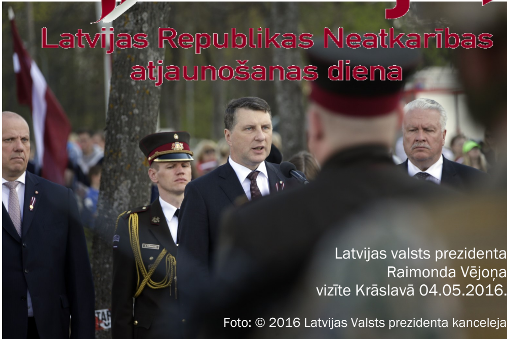
Latvijas valsts prezidenta Raimonda Vējoņa vizīte Krāslavā 04.05.2016.