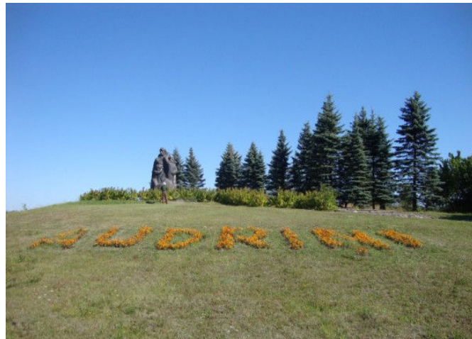
I. Dzene, biedrības “Gaismiņa” valdes locekle; aut. foto

Vairosim skaisto ap mums un dzīvosim sakārtotā vidē!