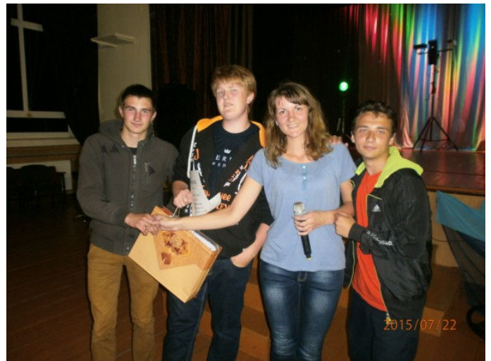
Audriņu komandas pārstāvji saņem apbalvojumu