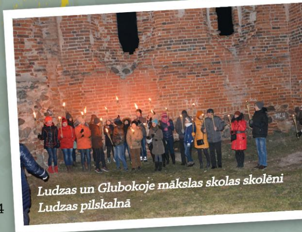
Ludzas un Glubokoje mākslas skolas skolēni Ludzas pilskalnā