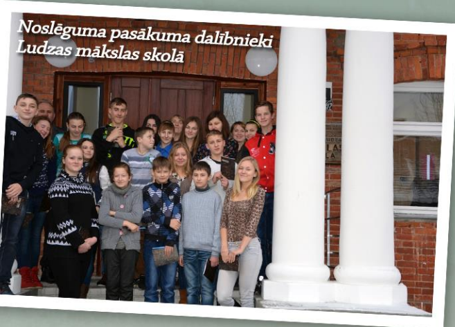
Noslēguma pasākuma dalībnieki Ludzas mākslas skolā

Laika posmā no 20.novembra līdz 23.novembrim Ludzā notika Projekta Noslēguma pasākums, kurā piedalījās Ludzas un Glubokoje mākslas skolu audzēkņi un pedagogi. Kopīgā darbā jaunieši iepazīna sava novada populārāko mākslinieku ieguldījumu kultūrā un mākslā. Ludzas mākslas skolas pedagogi baltkrievu bērņus iepazīstināja ar Antona Kūkoja daiļradi, mākslu. Pasākuma laikā tika apmeklēta mākslinieka dzimtā vieta – Rogovkā, Nautrēnu skola, mākslinieka kapavieta, kā arī Kūkoja piemineklis Rēzeknē.