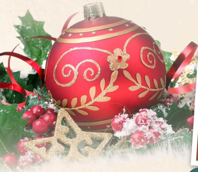
Foto: Jaunstrūžānu skolēnu sagatavotie rotājumi

Europe Direct Informācijas centra Austrumlatgalē vadītājas asistente