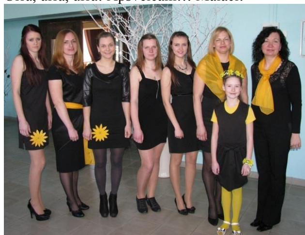
Vokālais ansamblis „Septīma”

Skates repertuāru visā pilnībā varēsim izbaudīt lielajā Lieldienu koncertā. Liels paldies visiem dziedātājiem par centību, par izaugsmi, jo skatē tika uzrādīti augsti rezultāti. Pirmo reizi mūsu „Ilūzijai” un „Septīmai” 2. pakāpes diplomu! Savukārt trio „Rondo” sev izdziedāja visaugstāko apbalvojumu – 1. pakāpes diplomu! Urrā, urrā, urrā! Apsveicam!!! Malači!