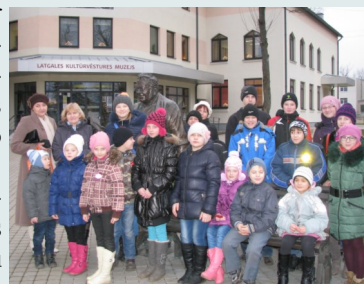
Pie Latgales kultūrvēstures muzeja