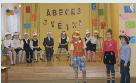
Buratino, Burtu meitiņa un Nezinītis viesojas pie pirmklasniekiem

Ābecīte ar saviem pavalstniekiem – burtiņiem un, aicinot visus skolēnus doties ceļojumā ar jautru burvju vilcieniņu, apmeklēja stacijas „Alfabētiņš” un „Mini mīkliņu!” Pirmklasnieki pasākumā gan lasīja