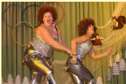
„Faziras” meitenes amizējas uz Galēnu skatuves

Pasākums noritēja īsti olimpiskā garā. Dienā notika dažādas netradicionālas sporta spēles, bet vakarā kon-