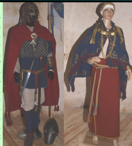
Senie latgaļu tērpi