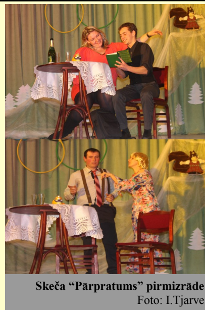
Skeča „Pārpratums” pirmizrāde

„Savējie” ir atraduši jaunus draugus Galēnos – vidējās paaudzes deju kolektīvu „Amizieris.” Ceram uz