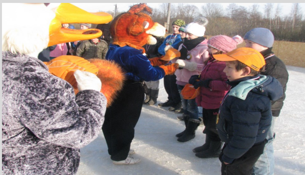
Swedbank pārstāvji pasniedz sacensību dalībniekiem sarūpētas dāvanas

Uz to ieradās apmēram 100 cilvēki. Lai to padarītu interesantāku, tika organizētas komandu spēles bērniem. Spēlēm pieteicās 5 komandas, piecu cilvēku sastāvā no Feimaņu pamatskolas. Uz tām ieradās arī Swedbank pārstāvji, lai iepriecinātu mazos sportistus ar balvām, kā arī izklaidētu