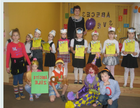
Pirmklasnieki kopā ar Ābecīti, Burtu meitiņu, Nezinīti, Buratino un Klaunu.

Pirmsskolas un 2.-4.klašu skolēni uz svētkiem bija ieradušies ar jaukām un interesantām dāvanām, kā arī ar radošiem uzdevumiem. Liels bija pārsteigums, kad ar krāsainiem baloniem rokās ieradās klauns.