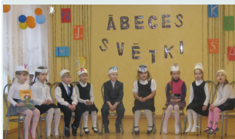
Pirmklasnieku Ābeces svētki

28.02.2014. plkst.13:30 —pašvaldības deputātu, darbinieku un iedzīvotāju ziemas olimpiāde Kaunatas pagastā.