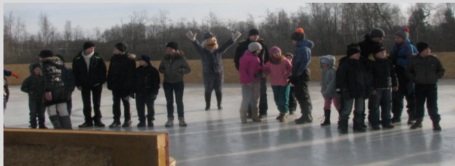
Komandu pulcēšanās pirms sacensībām

2014. gada 6.februārī pie Feimaņu pagasta pārvaldes „Open mind” projekta ietvaros norisinājās mini hokeja laukuma atklāšana „Jautrais ledus”.