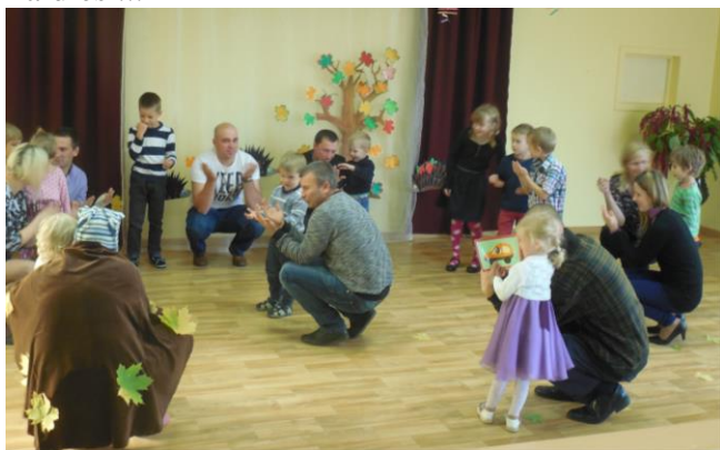
Attēlā: dārziņā Tēvu diena!