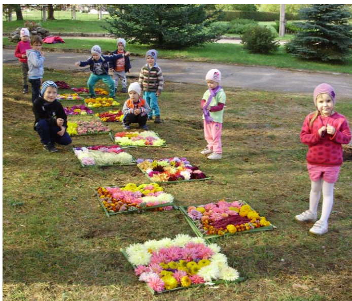
Attēlā: bērni pie saviem puķu lodziņiem.