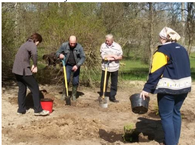
Attēlā: lielās stādīšanas mirklis.