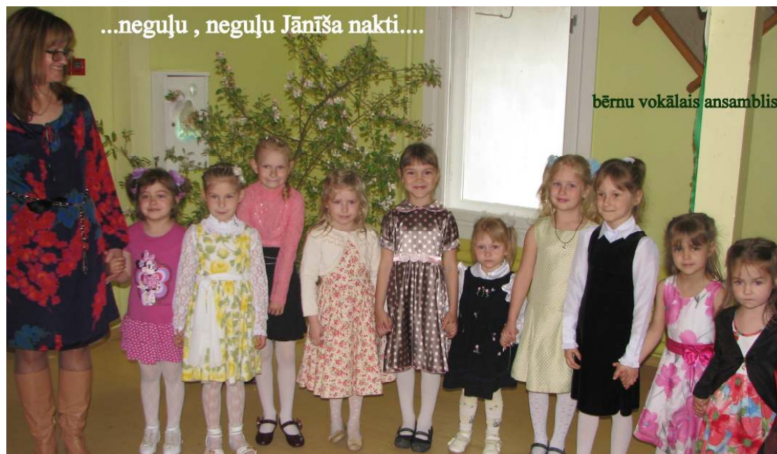
Foto no Māmiņdienas pasākuma