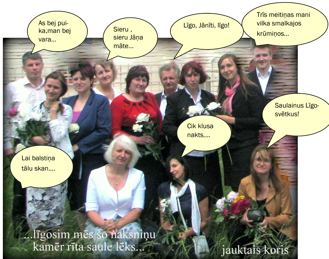
Foto no Vasarasvētku koncerta Rozentovas baznīcā