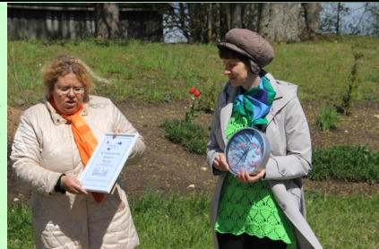
Eiropas Parlamenta Informācijas biroja sagādātās dāvanas