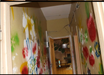
Paredzamo telpu renovācija