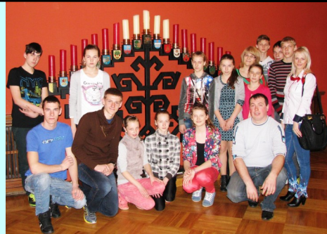
Jauniešu apmeklējums Saeimā.

Nākamās četras stundas tika aktīvi pavadītas Līvu ūdens atrakciju parkā, kas ir īpaši draudzīgs atpūtai ar bērniem un jauniešiem. Akvaparkā bija iespēja izbaudīt vairākas dažādas atrakcijas -baseinus, saunas, džakuzi, atrakciju kalniņus, „Tornado Lāsēnu”, „Ūdens cilpu”, viļņu baseinu u.c.