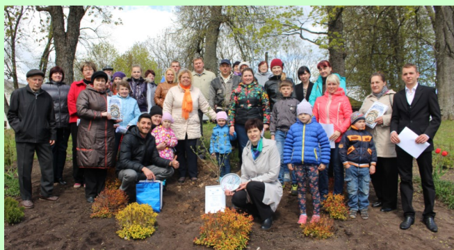
Vēlēšanu ABC tūres apmeklētāji