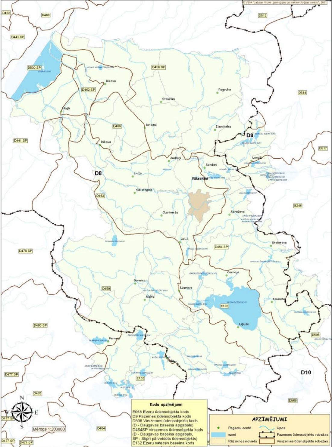
5.pielikums. Daugavas baseina apsaimniekošanas plāna ūdensobjektu robežas Rēzeknes novadā 31